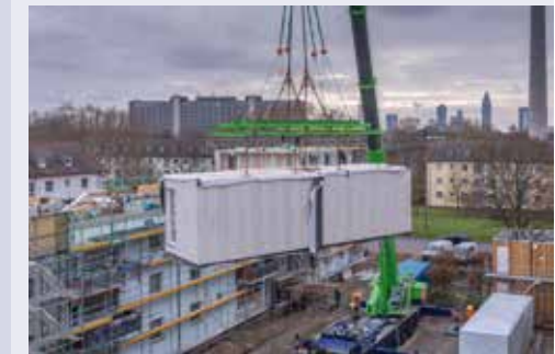
Aufstockung der Häuser in der Platensiedlung